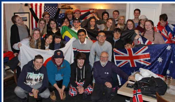
Se flere bilder fra WinterCamp på side 26

Jeg er svært takknemlig for at Nesbyen Rotaryklubb (som initierte det hele) og Rotary Foundation ga meg den unike muligheten til å studere ved et av verdens fremste universiteter, noe som har hatt en enorm betydning for min videre karriere.